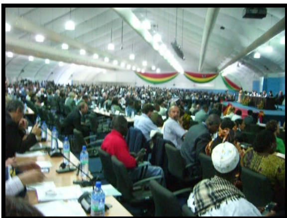
III Foro de Alto Nivel sobre Eficacia de la Ayuda ( www.accrahlf.net )

Conferencia de Financiación para el Desarrollo, Naciones Unidas, Doha