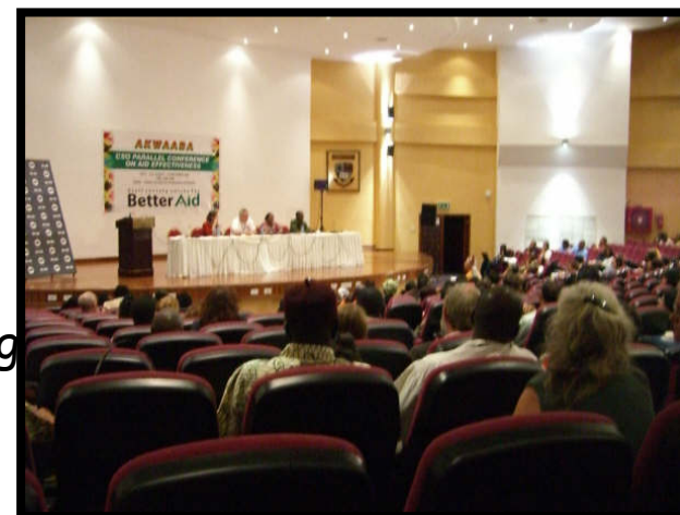
Foro Paralelo de la Sociedad Civil ( www.betteraid.org )