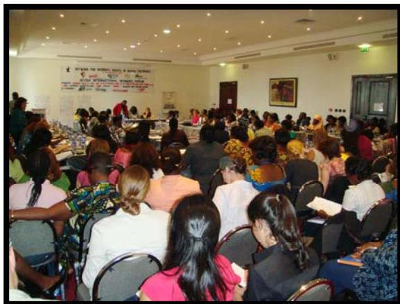
Foro Internacional de Mujeres (NETRIGHT)